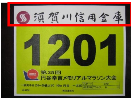
大会ナンバーカード例