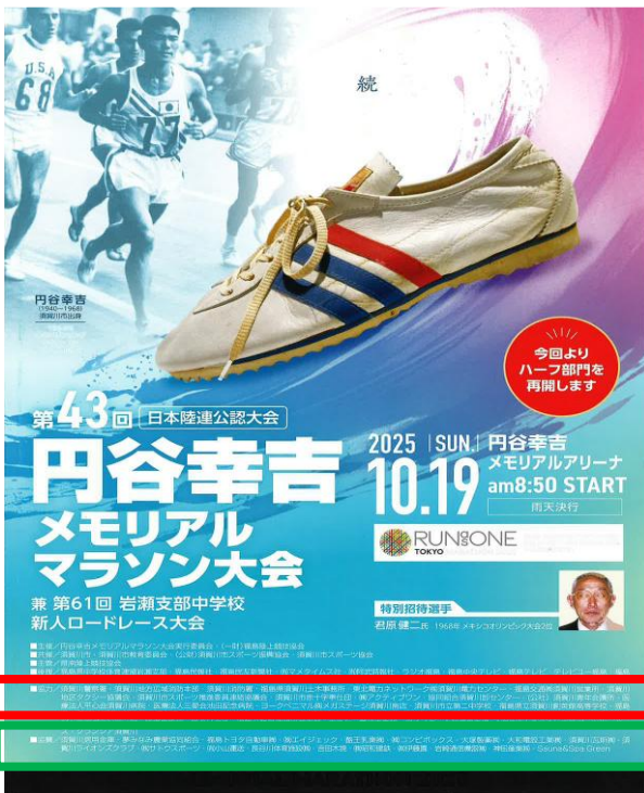
例:大会プログラム(企業ロゴの記載はありません)